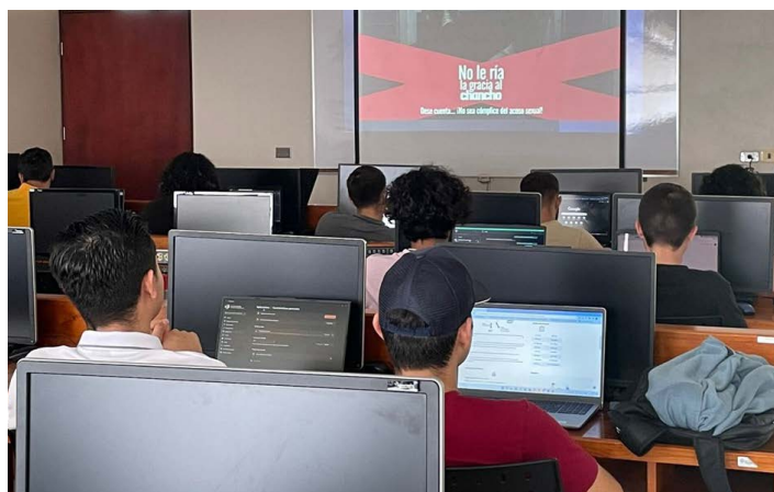
Figura 2. Evidencia de actividad de cierre de campaña con estudiantes

a las personas estudiantes tres imágenes para educar sobre el acoso callejero y sus impactos negativos.