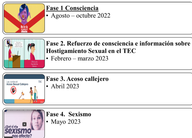
Figura 1. Fases de la campaña