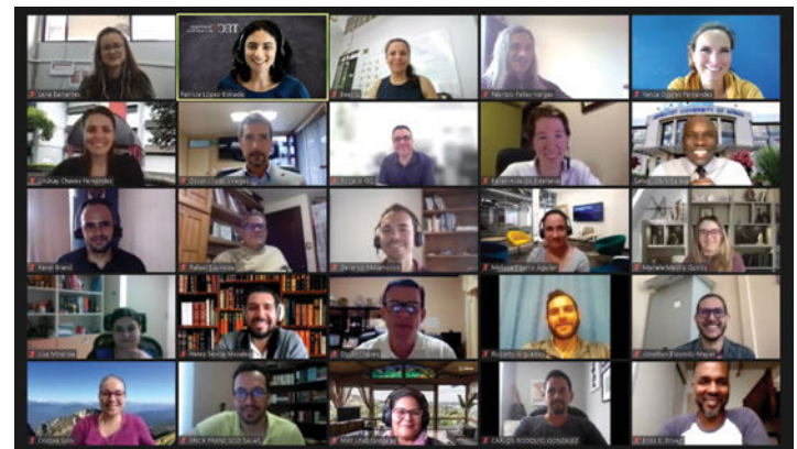
Taller de Análisis de datos cualitativos, segundo día. Fuente: López-Estrada, P. 2021.