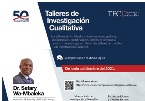
Afiche oficial divulgado por comunicación interna.