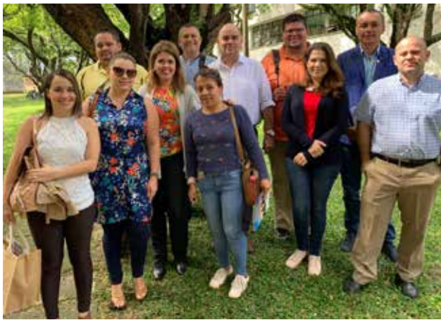
Equipo del proyecto en Universidad Pontificia Bolivariana, Medellín Colombia, mayo 2019