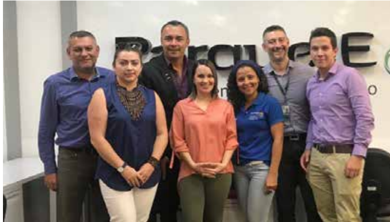
Algunos miembros del proyecto en Parque E Universidad de Antioquia

Fuente: Propia, Medellín Colombia, mayo 2019