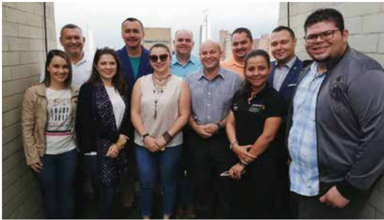
Equipo del proyecto en UCC

Fuente: Propia, Medellín Colombia, mayo 2019