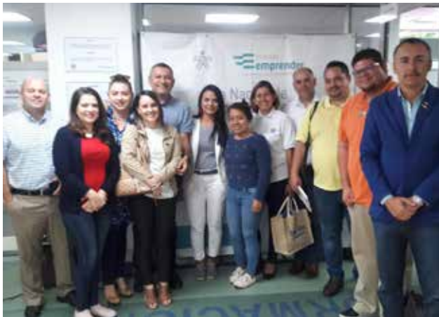
Equipo de trabajo en Servicio Nacional de Aprendizaje (SENA)

(reutilización de productos como materia prima para nuevos productos). Tienen una incubadora sin costo para los emprendimientos de sus estudiantes y se les asigna un asesor externo. Se encuentran apoyando actualmente a 14 empresas, en donde se pretende mejorar la productividad, así como cerrar la brecha entre la academia y el sector empresarial.