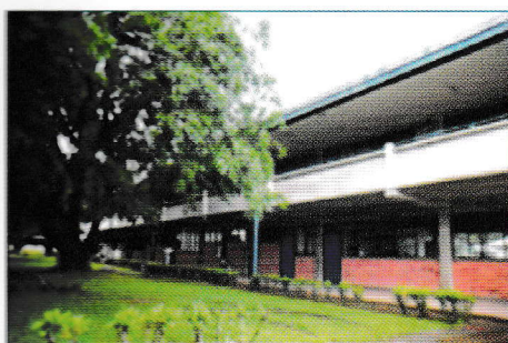
Las únicas dos carreras universitarias impartidas en la Zona Norte que ostentan el sello de calidad del SINAES pertenecen al Instituto Tecnológico de Costa Rica. La imagen corresponde a esta sede del TEC, ubicada en Ciudad Quesada.

La acreditación oficial es diferente, se trata de un riguroso proceso evaluativo al que voluntariamente se someten aquellas carreras que desean garantizar su calidad con un Certificado Oficial expedido por el Sistema Nacional de Acreditación de la Educación Superior (SINAES), institución a la que el Estado costarricense le otorgó esa potestad