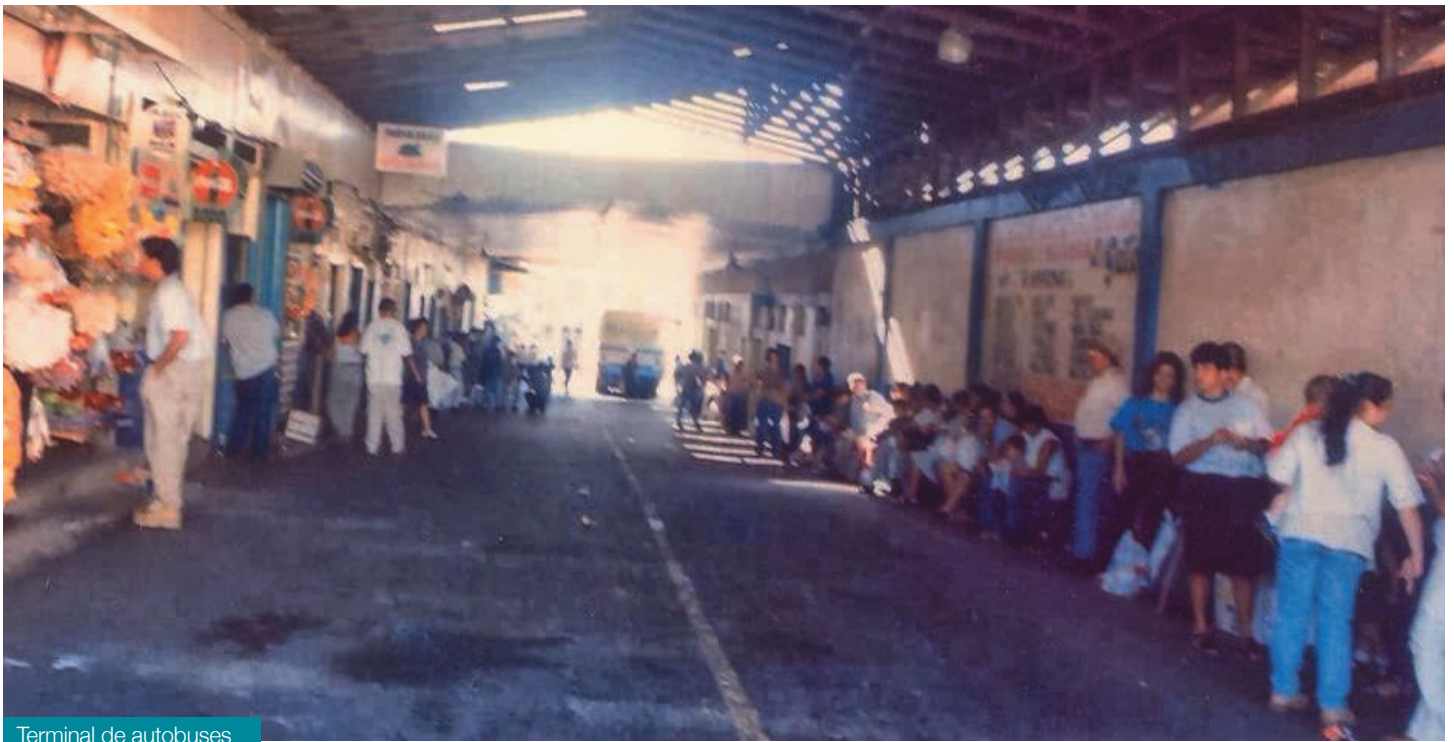
Terminal de autobuses

Cima, así como 1980 el periódico San Carlos al Día y en 1984 Radio Santa Clara y en los últimos años Canal 14 y 51. Así como iniciativas ciudadanas en Internet como la revista Norte En Línea.