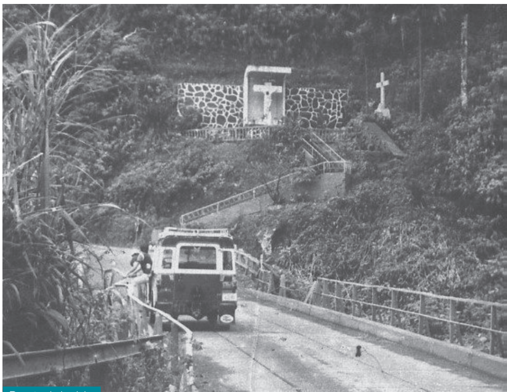
Puente de la vieja