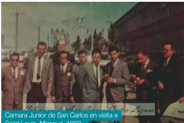
Camara Junior de San Carlos en visita a Saint Louis, Missouri. 1969

Empresa Matamoros generó también electricidad.