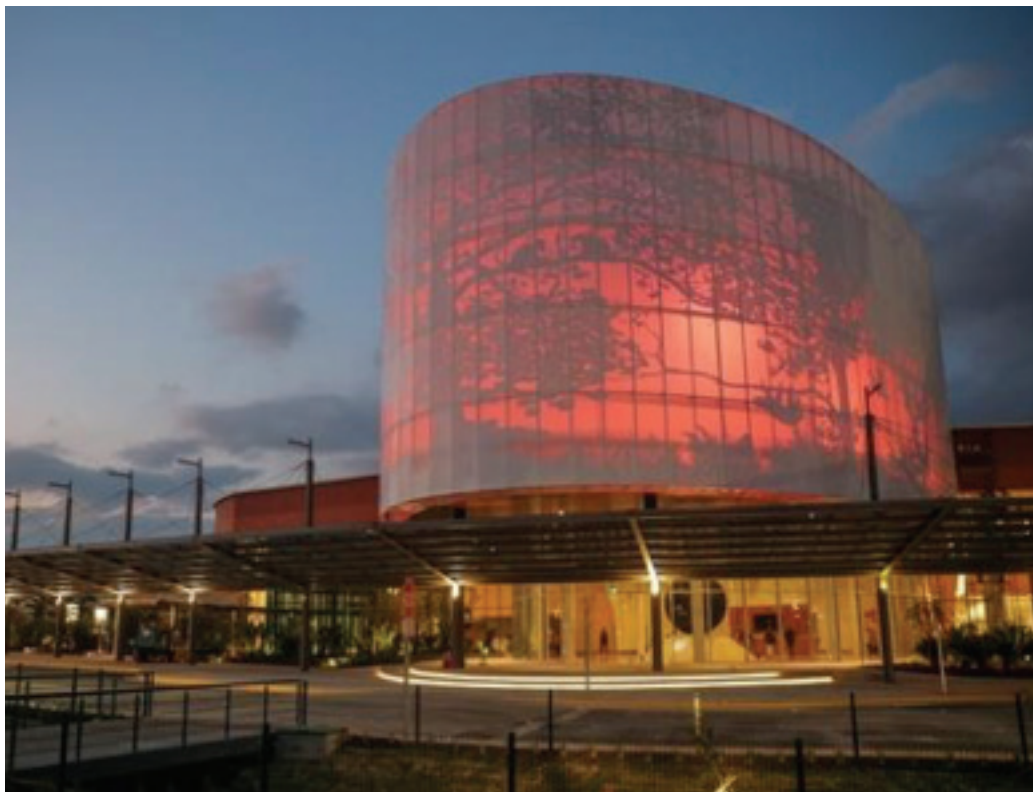
El 5 de abril de 2018, se inauguró el Centro Nacional de Congresos y Convenciones. Tiene reservaciones desde ahora y hasta el año 2021, que representarían ingresos de aproximadamente $250 millones de dólares. Fuente: La Nación, abril 2018.

y la Prevalencia del HIV prácticamente mantienen la misma posición del año 2013, entre los puestos 55 y 60 de la lista.