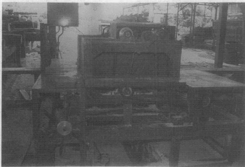
FIGURA 3. Versión Estacionaria. Año de fabricación 1992. Propiedad: Los Nacientes S.A.

Con base en esta experiencia, se fabricó otra máquina a la cual se le han agregado mejoras, encontrándose actualmente dicha maquina en operación industrial. En la Figura 4 se presenta un