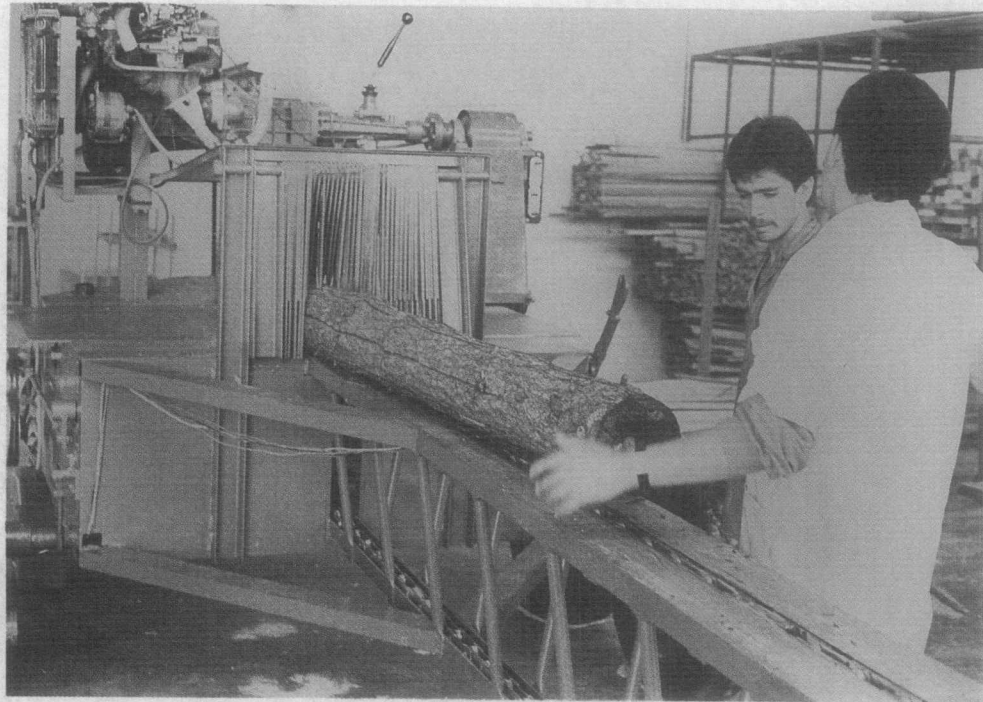
FIGURA 2. Prototipo en metal, versión móvil. Año de fabricación 1991.