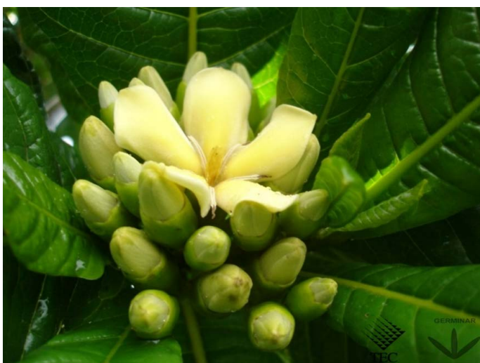
Figura 1. Fruto de Guaitil.