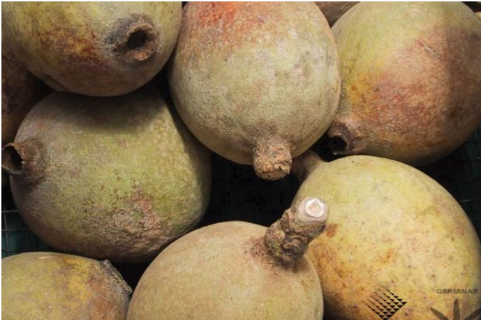
Figura 2. Flor de Guaitil.