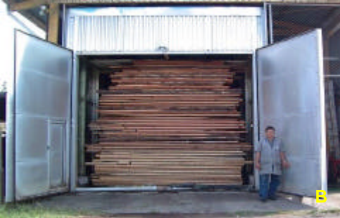
Secadores tipo convencional. A. solar capacidad 6 m 3 . B. NARDI ® , capacidad 20 m 3 . (Cortesía R. Córdoba, 2005). C. NARDI ® , capacidad 2 m 3 . Instituto Tecnológico de Costa Rica.