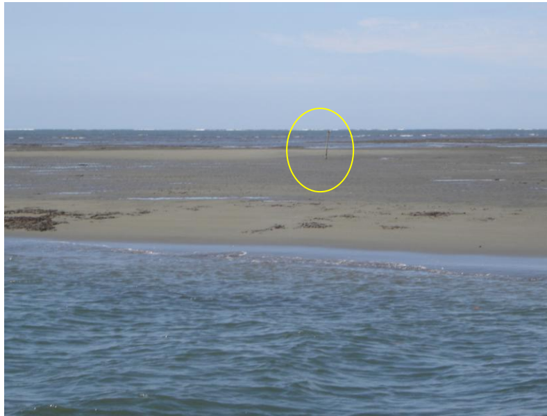
Figura 3. Estado del manglar Guarumal en diciembre del 2007 (Costa Rica). Obsérvese el tronco de mangle que todavía está en pie en el banco de arena, último reducto de lo que fue un manglar en 1973.

2005, lo que indica que posiblemente se vaya a seguir recuperando, y que probablemente se una con la isla barrera formada en torno a la isla Temblona (Figura 3).