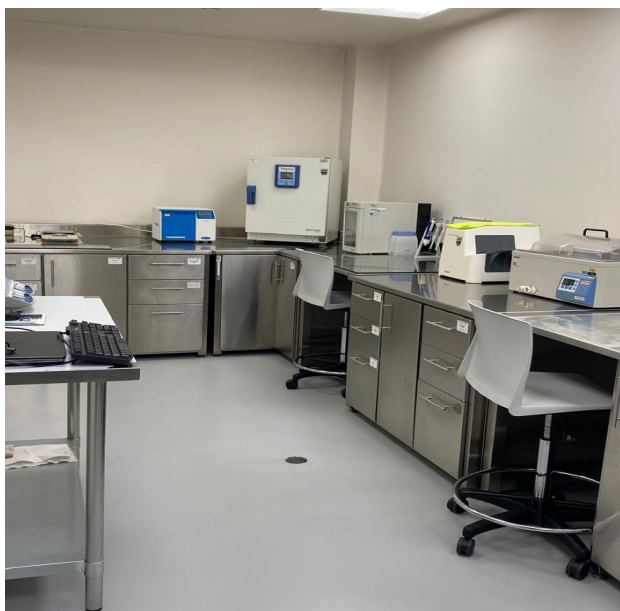
Figura 1. Instalaciones del Laboratorio de Microbiología de Aguas y Alimentos CEQIATEC.

El Laboratorio de Microbiología de Aguas y Alimentos que forma parte del Centro de Investigación y de Servicios Químicos y Microbiológicos (CEQIATEC) (Figura 1) de la Escuela de Química del Instituto Tecnológico de Costa Rica presta servicios de ensayos acreditados bajo la norma ISO/IEC 17025 ante el Ente Costarricense de Acreditación (ECA).