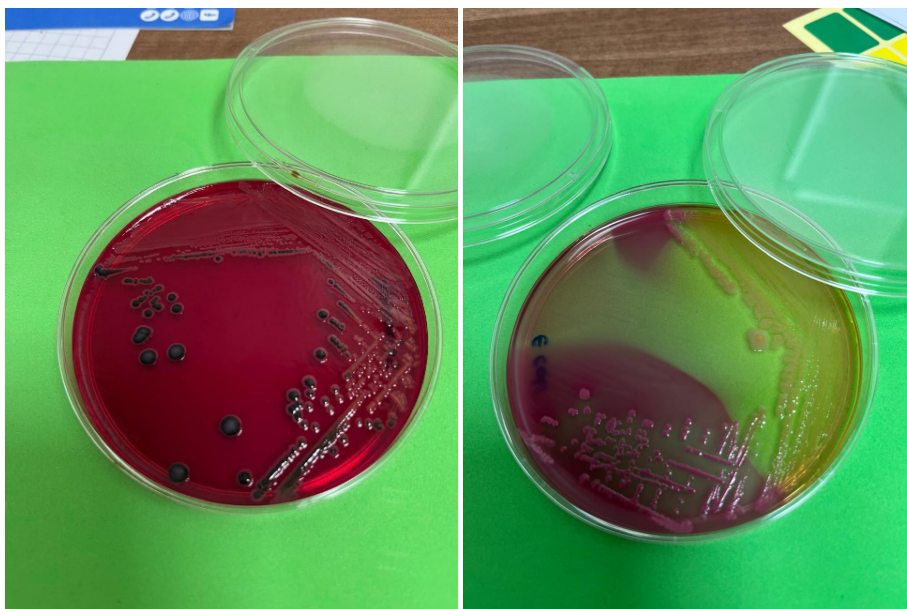
Figura 3. Cepas bacterianas usadas en las pruebas de laboratorio.

Uno de los principales retos consistió en calcular y controlar la incertidumbre de la medición, ya que, a diferencia de métodos fisicoquímicos, la estimación de incertidumbre en microbiología requiere abordar la variabilidad inherente al crecimiento microbiano, así como, la heterogeneidad en las muestras y los procedimientos de cultivo y recuento.