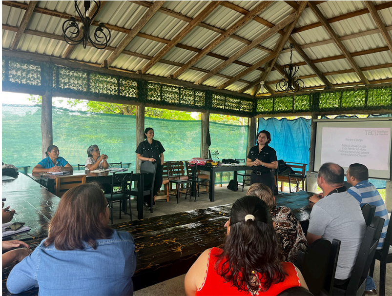
Fig. 2. Visita 1. Evidencia del proceso comunitario diagnóstico el 23 de marzo de 2025 en San Ramón de La Virgen de Sarapiquí con la participación de 14 personas emprendedoras.

Después de esta visita, se socializó la ficha técnica para obtener información de los emprendimientos. La ficha buscaba obtener información general y específica de cada emprendimiento; i.e. , fecha de fundación, información de contacto, información de redes sociales, breve historia del emprendimiento, misión, público meta, descripción de la actividad o servicio, precios, entre otros. Esta ficha se adaptó en Google Forms para hacer el proceso más expedito y, con los datos proporcionados, se empezó a trabajar en la traducción.