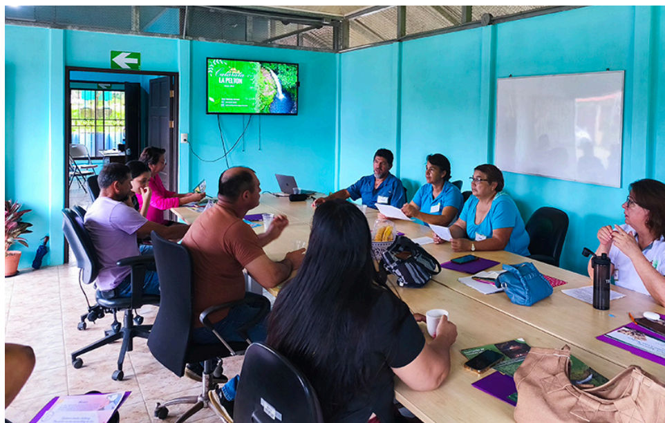
Fig. 4. Capacitación en inglés para las personas emprendedoras.

Un aspecto destacado fue la motivación con la que las personas emprendedoras participaron en la creación del material gráfico de sus negocios. Todas colaboraron aportando fotografías de alta calidad y, en algunos casos, diseñaron por primera vez el logo de su empresa para incluirlo en los materiales. Esta respuesta entusiasta reflejó el compromiso y la ilusión de ver sus esfuerzos representados en productos informativos tanto impresos como digitales. Esta segunda reunión con las personas emprendedoras constituyó un valioso espacio de interacción y diálogo entre las extensionistas, las personas emprendedoras asociadas a COOPROTURS R. L. y los miembros de la comunidad, a la vez que responde a uno de los pilares de gestión de conocimiento planteados en la propuesta de esta actividad de fortalecimiento de la extensión.