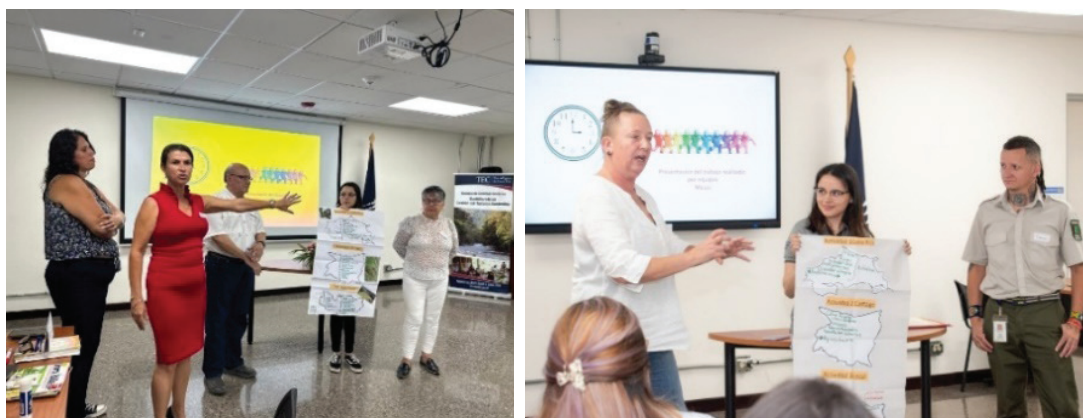
Figura 1. Presentación de las personas participantes durante el desarrollo de los Talleres de las JPP en agosto y setiembre de 2023.

Participaron 72 personas: 42 de Cachí y Orosí, y 30 de Santiago, Santa Lucía y Paraíso. Los perfiles incluyeron representantes de micro, pequeñas y medianas empresas (MiPymes) y de pequeñas y medianas empresas (Pymes) (54,2%); instituciones públicas (26,4%); asociaciones de desarrollo (6,9%); y otros actores, como municipalidades, universidades públicas y gestores turísticos (5,6%).