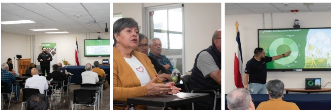
Figura 3. Presentación de los resultados obtenidos de los Talleres Participativos y Grupos Focales de la JPP. Fuente: [1].

Las JPP permitieron evidenciar tres áreas clave: