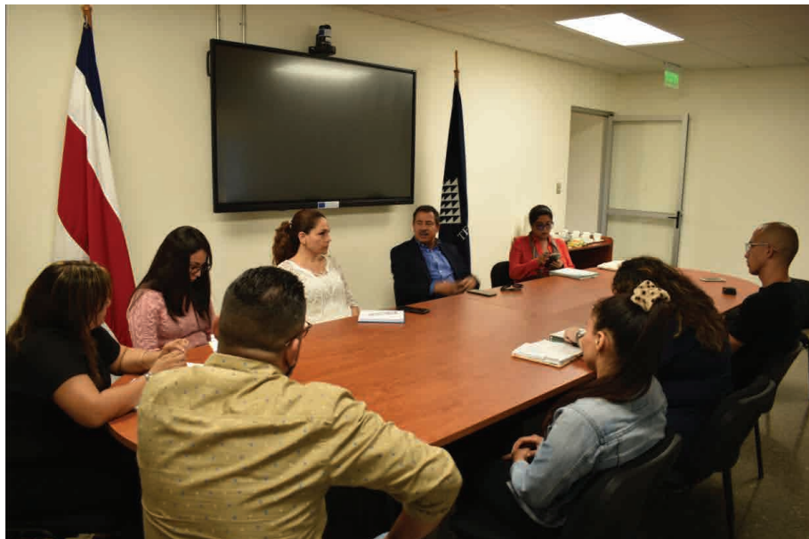
Figura 1. Reunión de la Municipalidad de Cartago junto con la coordinación de Gestión del Turismo Sostenible, para solicitud de apoyo en generar el proceso de la Jornada Participativa Octubre del 2022, Escuela de Ciencias Sociales.

La Primera Jornada Participativa sobre Desarrollo Turístico (1JPDTC) se enmarcó como una colaboración brindada por el Instituto Tecnológico de Costa Rica (ITCR), por medio de la carrera de Gestión del Turismo Sostenible (GTS), dentro del marco de la “Estrategia del Anillo Turístico de la provincia de Cartago y Los Santos”, bajo la figura Ad honorem, durante los meses de noviembre del 2022 a enero del 2023.