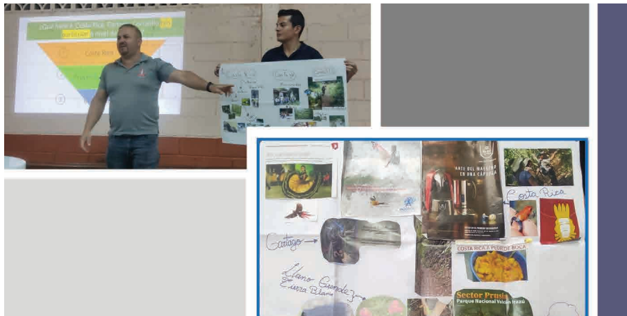
Figura 6. Participación de las personas actores sociales y papelógrafos (enero, 2023)

La información se recopiló en tres talleres, por medio de la técnica de grupo focal y el uso de papelógrafos, los datos fueron organizados en tablas de frecuencia y matrices de análisis para facilitar su organización e interpretación.