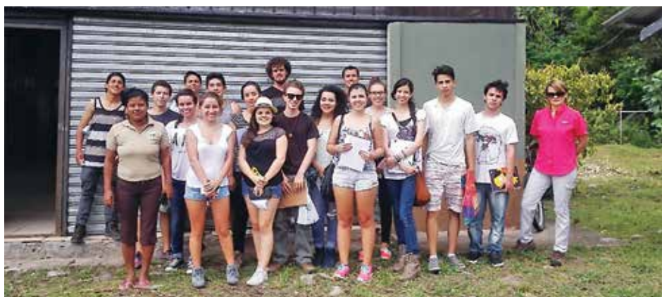
Estudiantes de la Escuela de Diseño Industrial participaron en la elaboración del diseño del empaque.

Para los años 2011 y 2012 se establece un plan de producción agropecuaria sostenible en Shuabb, mediante un proyecto inscrito en la Vicerrectoría de Investigación y Extensión que finalizó satisfactoriamente. Entre el 2012 y el 2013 se implementó un modelo de finca diversificada en Shuabb y Suretka y en