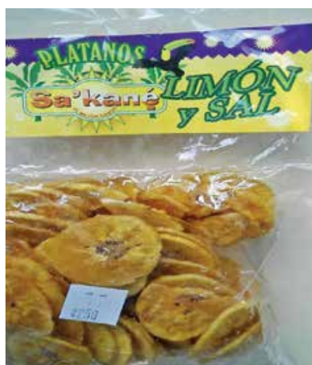
Nuevo empaque utilizado por la Cooperativa Coopetsiola.

el 2014 se estableció un centro de acopio de arroz en Shuabb.