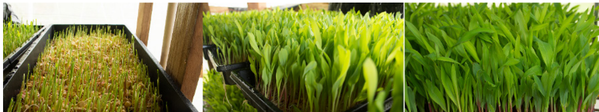
Figura 1. Desarrollo del FVH, de izquierda a derecha: tres, siete y diez días respectivamente.

El resultado del análisis bromatológico realizado al FVH en cosecha se presenta en el Cuadro 2, siendo destacables los indicadores de Proteína Cruda (17,79) y Energía Digestible (3,44).