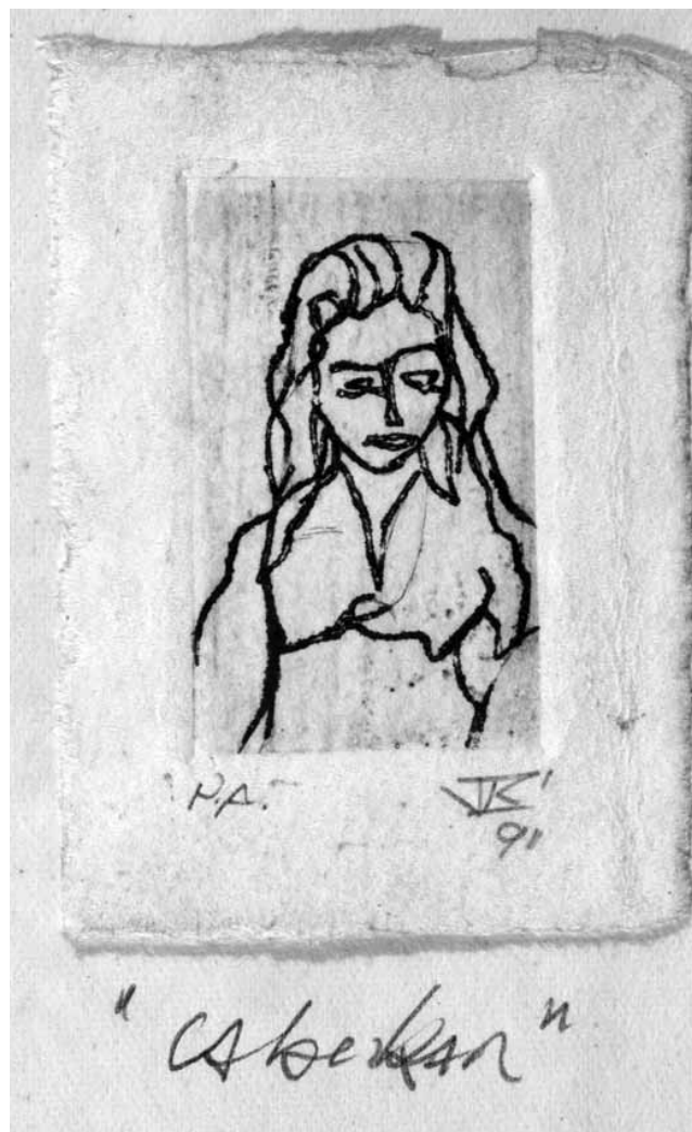
Juan Luis Rodríguez S. CABÉCAR en CRÓNICA CABÉCAR Y OTROS, 1991. Grabado impreso sobre papel hecho a mano. P/A. 4 x 2.4 cm. ft RRubi mar2012.