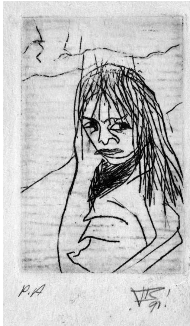
Juan Luis Rodríguez S. CABÉCAR en CRÓNICA CABÉCAR Y OTROS. 1991. rabado impreso sobre papel hecho a mano. P/A. 6.5 x 4 cm. ft RRubi mar2012.

Los docentes que provenían de Estados Unidos gozaban de una serie de privilegios. Se les pagaba en pesos oro americanos, el Estado cubría los gastos de transporte en primera clase, trabajaban cuatro horas diarias y además, se les daba alimentación y hospedaje. La siguiente carta es un ejemplo de algunos de los privilegios gozados por un profesor de inglés que procedía del extranjero. En los documentos revisados no se indica la cantidad que llegó al país en aquel momento, pero es de suponer que venían exclusivamente para impartir lecciones en el Li-