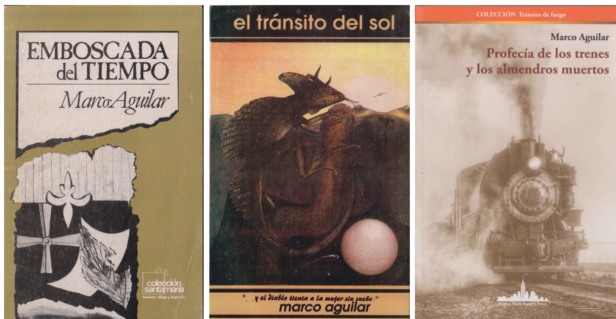
Carátulas de tres de sus libros.

Por cierto, y como elemento curioso –léase furioso–, en la primera edición, los datos biobibliográficos del autor eran más escuetos que los del compilador, quien, al parecer, pretendía quedarse con los derechos de autor. Habrase visto mayor infamia, sobre todo tratándose de un poeta humilde, de escasos recursos y con nula percepción de aquellos derechos. Eso, de alguna manera, subraya la condición de un poeta que “no desea hacer literatura”, tal y como