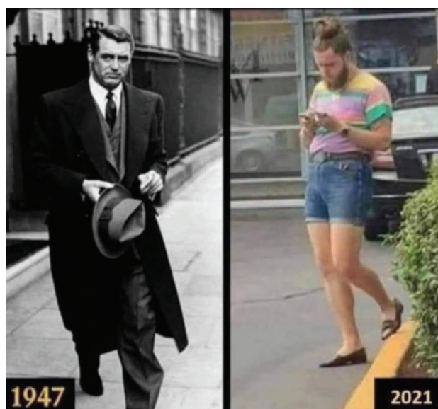
Figura 3. Meme usado para contrastar una masculinidad varonil y otra masculinidad ecléctica y feminizada

Fuente: Facebook Profesionales contra la Ideología de Género en CR, publicado el 27 de mayo del 2022