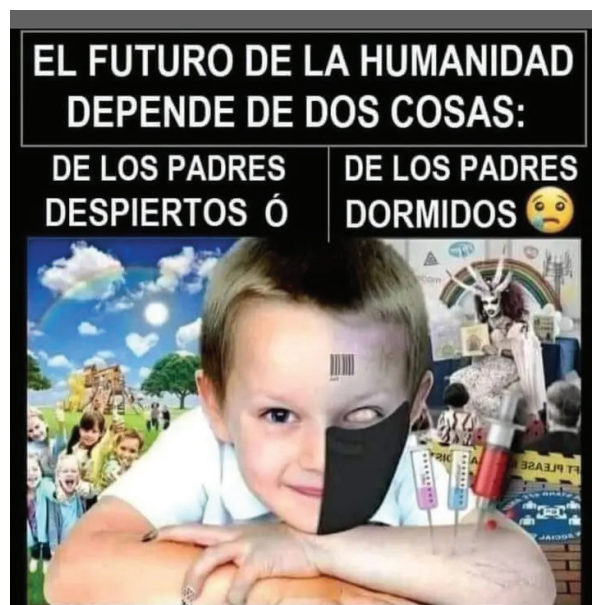
Figura 4. Meme usado para alertar a los padres y madres de familia sobre las posibles consecuencias de la ideología de género sobre las personas menores de edad