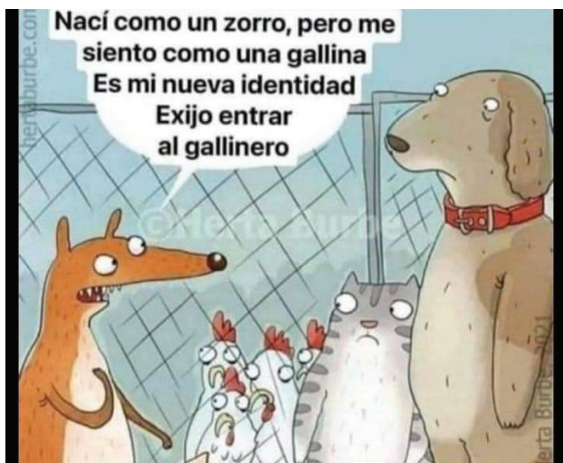
Figura 2. Meme utilizado para ironizar sobre la población trans y las consecuencias de quienes desean aprovecharse de las identidades flexibles