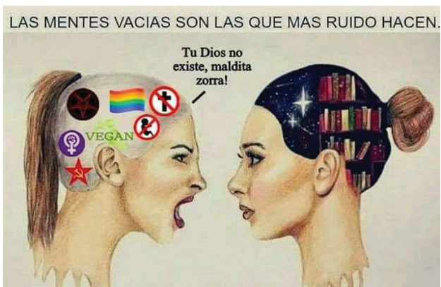
Figura 7. Meme que enfatiza el estado mental calmado de las mujeres conservadoras versus el estado alterado de las mujeres progresistas