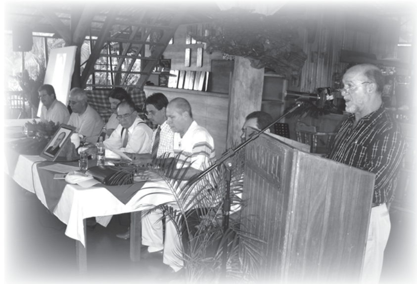
Homenaje al Maestro Joaquín García Monge Turrialba, Costa Rica. Octubre 2007